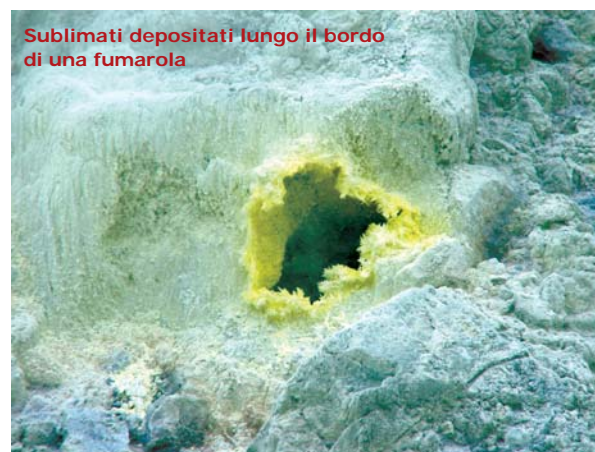
Sublimati depositati lungo il bordo di una fumarola

La temperatura delle fumarole, che è normalmente molto elevata, varia dai 100° ad oltre 800°C. Lo zolfo presente nelle fumarole, a contatto con l'atmosfera, si deposita formando cristalli ( sublimati ) che hanno il caratteristico colore giallastro. Questa mineralizzazione è il risultato del passaggio dalla fase gassosa a