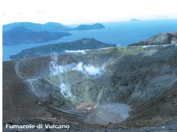
Fumarole di Vulcano

Soprattutto nel caso di vulcani il cui condotto è ostruito, come ad esempio il Vesuvio, una parte dei gas raggiunge la superficie terrestre, infiltrandosi nei suoli attraverso i pori delle rocce e le fratture che interrompono la continuità dei terreni vulcanici. Tale processo porta alla formazione delle fumarole che si possono presentare in manifestazioni singole o in forme complesse chiamate campi fumarolici .